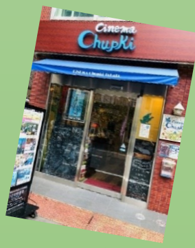
☆シネマ・チュプキ・タバタ☆