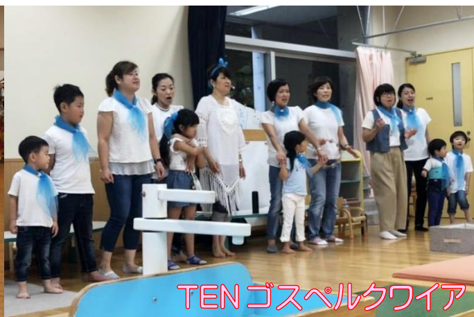
TENゴスペルクワイア