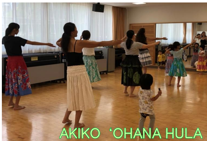
AKIKO 'OHANA HULA