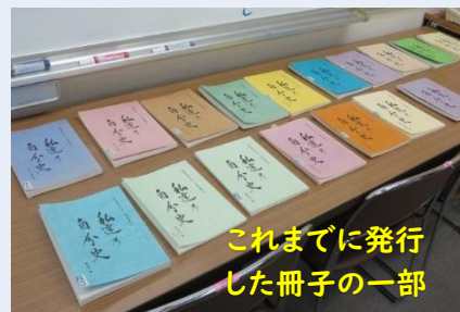
これまでに発行した冊子の一部