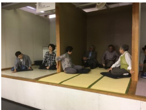
震度7の揺れを体験しました