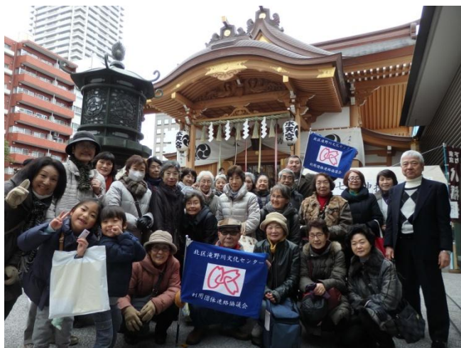
水天宮で全員揃って記念撮影